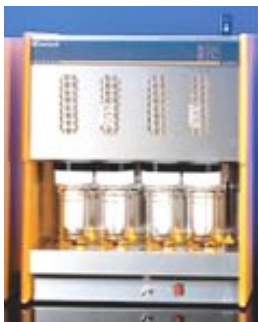
EXTRATORES POR SOLVENTE AUTOMÁTICO