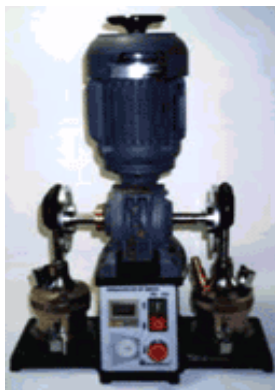
TRABALHADOR DE GRAXA