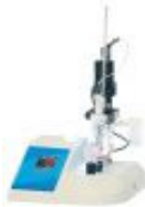
PONTOS DE FUSÃO