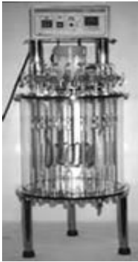
VISCOSÍMETROS CINEMÁTICO DE IMERSÃO