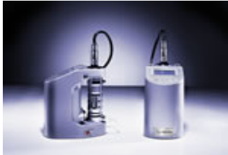
ANALIZADORES DE O 2