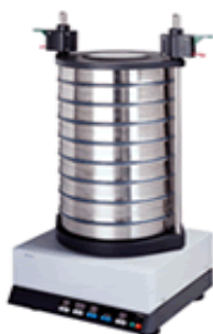
AGITADORES DE PENEIRAS