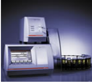
ANALIZADORES DE TEOR ALCOOLICO