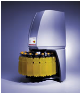
AMOSTRADORES AUTOMÁTICOS PARA CARBOQC