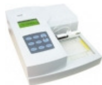
LAVADORA DE MICROPLACAS