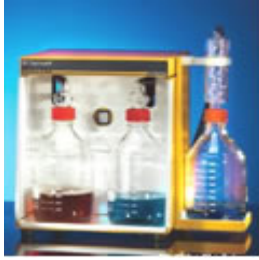
NEUTRALIZADORES DE GASES