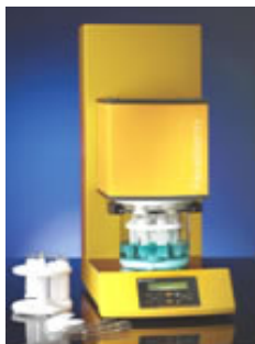
DETERMINADORES DE FIBRAS