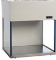
CABINE DE PCR