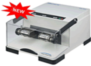
MOINHOS PLANETÁRIO DE ESFERAS