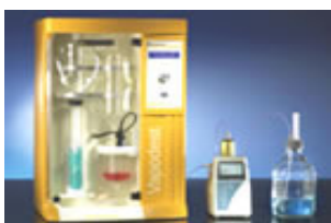
UNIDADES DE DESTILAÇÃO