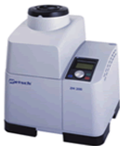
MOINHOS DE CENTRÍFUGA