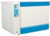
INCUBADORA DE CO 2