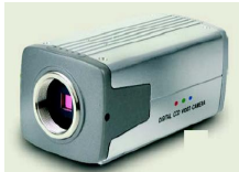
CAMERA DE VIDEO