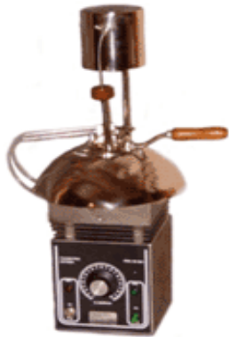
PONTO DE FULGOR