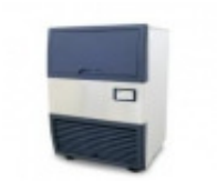
MAQUINAS DE GELO