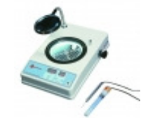
CONTADORES DE COLONIA