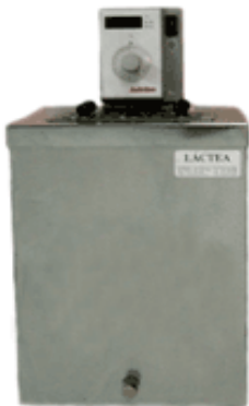
CORROSÃO DE COBRE