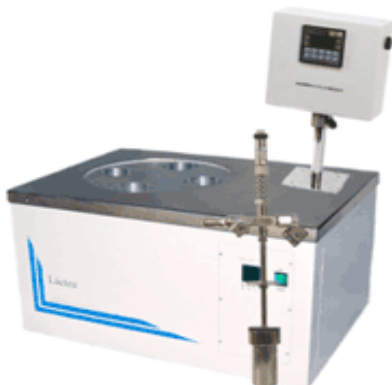
ESTABILIDADE DE GASOLINA