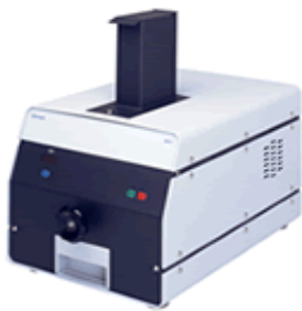
MOINHOS DE MANDÍBULA