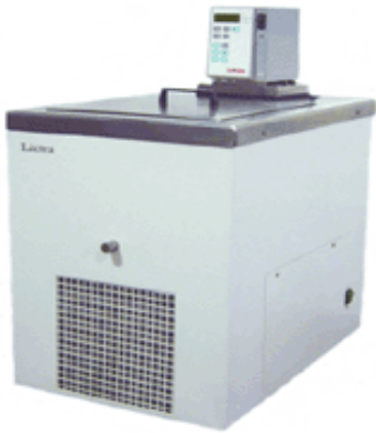
PONTO DE NÉVOA E FLUIDEZ