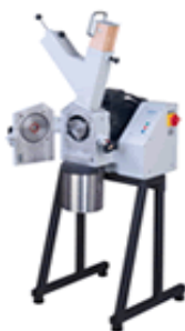
MOINHOS DE CORTE