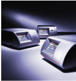
DENSÍMETROS DE BANCADA