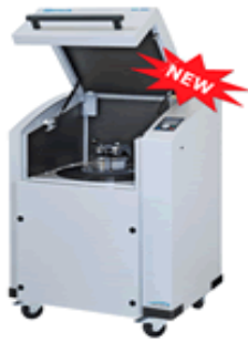
MOINHOS DE DISCO