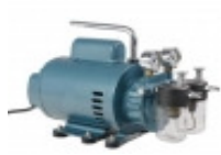
BOMBAS DE VÁCUO