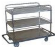
CARROS DE TRANSPORTE