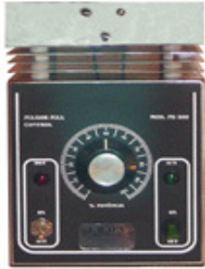
EXTRAÇÃO DE SEDIMENTOS EM ÓLEO