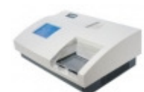
LEITORA DE MICROPLACAS