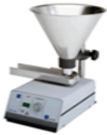
ALIMENTADOR AUTOMÁTICO PARA MOINHOS