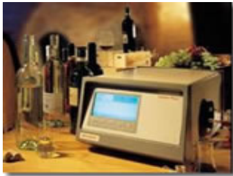
MEDIDORES DE TEOR ALCOOLICO