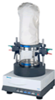
SISTEMA DE SECAGEM DE AMOSTRAS