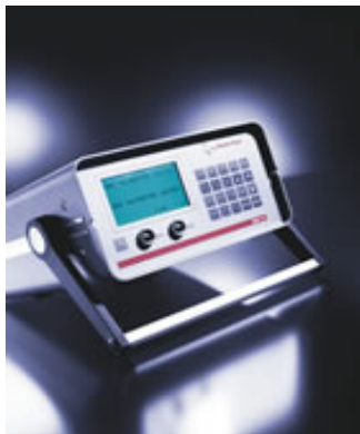
TERMÔMETROS DIGITAIS DE ALTA PRECISÃO