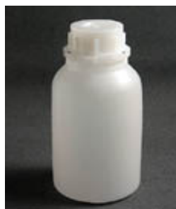
FRASCO CILÍNDRICO BOCA LARGA