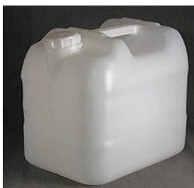
BOMBONAS DE 5, 10 E 20 LTS