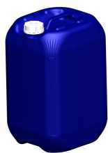
BOMBONAS DE 30, 50, 100, 150, 200 E 250 LTS

QUALQUER TIPO, TAMANHO E FORMATO DE RESERVATÓRIO PARA SEU LABORATÓRIO